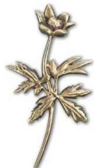
24. Valkovuokko 170 x 90 mm