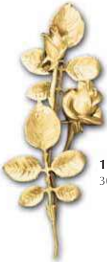
1. Ruusu 300 x 100 mm