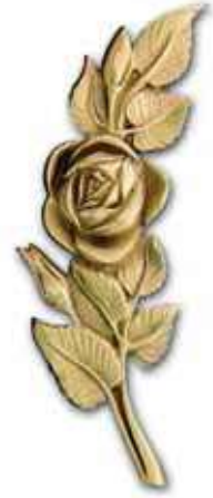
14. Ruusu 200 x 70 mm, oik/vas