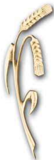
5. Tähkät 150 x 45 mm, oik/vas 210 x 55 mm, oik/vas 280 x 70 mm, oik/vas