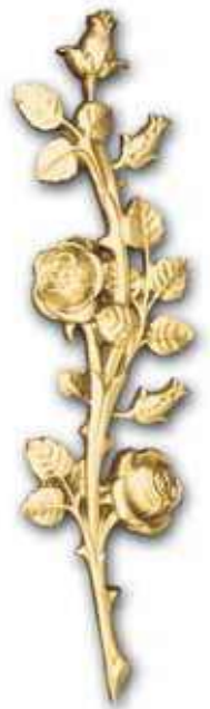
9. Ruusuköynnös 400 x 100 mm 560 x 100 mm