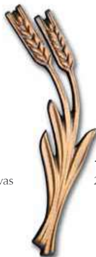
12. Kaksitähkäinen vilja 200 x 70 mm, oik/vas