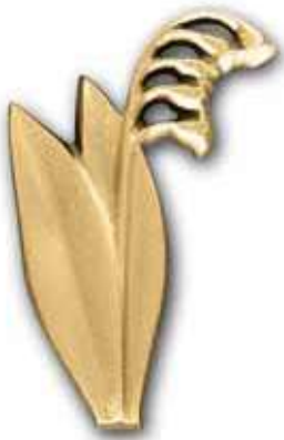
21. Kielo 100 x 60 mm