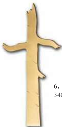
6. Runko 340 x 170 mm