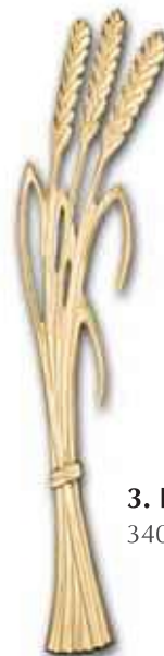
3. Lyhde 340 x 110 mm, oik/vas