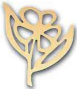
17. Pitsikukka 70 x 70 mm