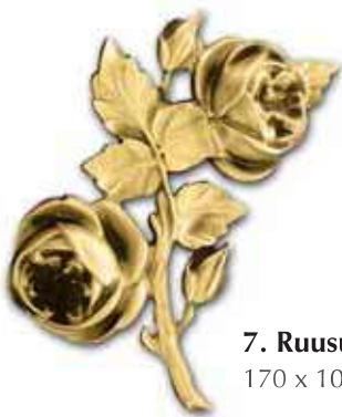
7. Ruusu 170 x 100 mm