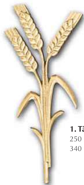
1. Tähkät 250 x 120 mm 340 x 160 mm