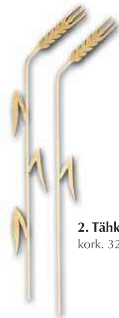
2. Tähkäpari kork. 320 mm, oik/vas