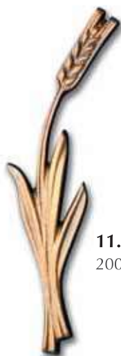
11. Vilja 200 x 50 mm, oik/vas