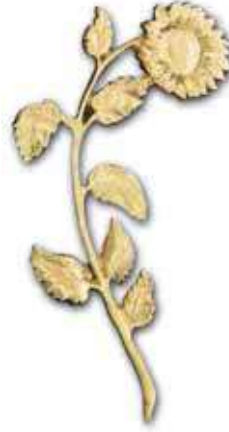
13. Päivänkakkara 190 x 100 mm, oik/vas