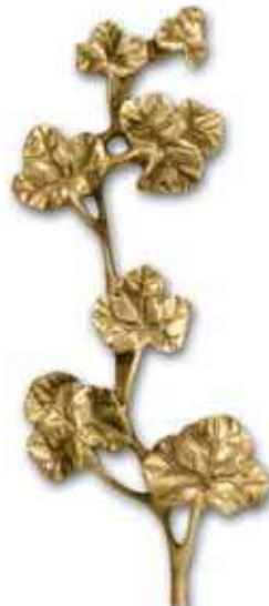
23. Muratti 190 x 75 mm