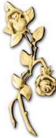
6. Ruusu 190 x 70 mm 280 x 100 mm