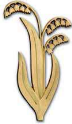
12. Kielo 150 x 90 mm 190 x 110 mm 250 x 150 mm