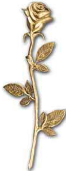
22. Ruusu 140 x 55 mm 180 x 80 mm 350 x 150 mm