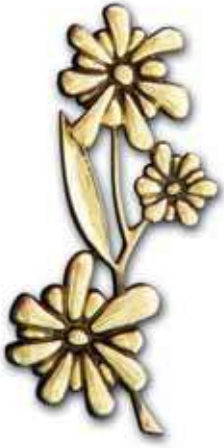
11. Krysanteemi 170 x 60 mm