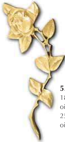
5. Ruusu 180 x 70 mm, oik/vas 250 x 90 mm, oik/vas