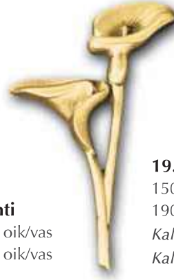
19. Kallapari 150 x 85 mm 190 x 110 mm Kallapariin voi yhdistää Kallanlehden nro 20.