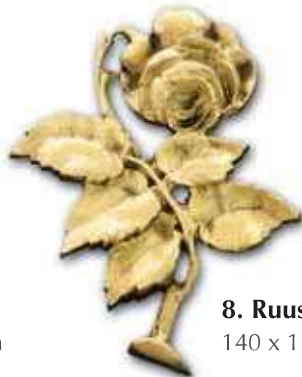
8. Ruusu 140 x 110 mm