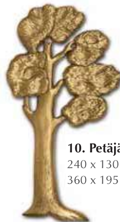
10. Petäjä 240 x 130 mm 360 x 195 mm