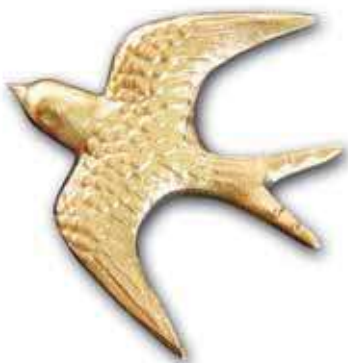
1. Pääsky siipien väli 60 mm 75 mm 95 mm 120 mm 135 mm