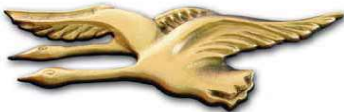
3. Joutsenpari 200 x 60 mm, oik/vas 270 x 90 mm, oik/vas