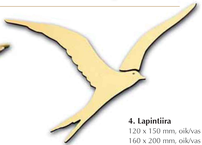
4. Lapintiira 120 x 150 mm, oik/vas 160 x 200 mm, oik/vas 210 x 320 mm, oik/vas